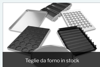
Teglie da forno in stock