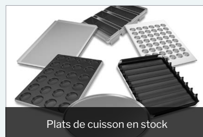
Plats de cuisson en stock